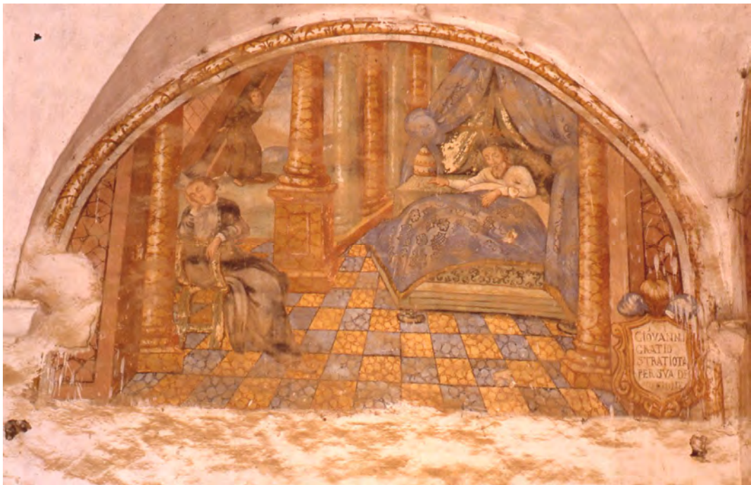
Chiostro del convento di Santa Maria del Palazzo. Sogno di Papa Innocenzo III. Foto della prima metà degli anni '70 del XX secolo.

Lunetta n. 5: Innocenzo III sogna che un religioso, un uomo piccolo e di aspetto spregevole, sostiene con le sue spalle la Basilica del Laterano che sta per crollare (2 Cel. XI,17; Leg. mag. III,10; Leg. min. II,IV; Tre Comp. XII,51; Clar. I,5; Salimbene III,34).