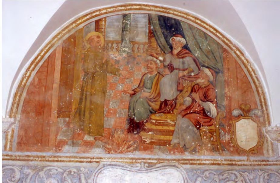
Chiostro del convento di Santa Maria del Palazzo. Francesco parla al sultano d'Egitto. Foto del 17 maggio 2000.

Francesco, in piedi, parla al Sultano d'Egitto che è seduto su un trono; accanto al sultano vi sono due dignitari di corte.