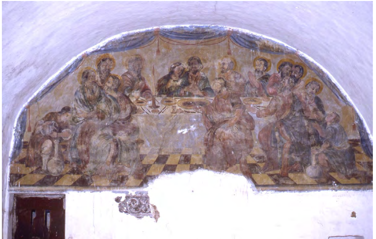
Refettorio del convento con affresco dell'Ultima Cena. Foto della prima metà degli anni '70 del XX secolo.