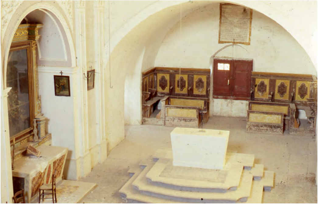
Interno della chiesa conventuale con coro ligneo. Foto degli anni '80 del XX secolo.