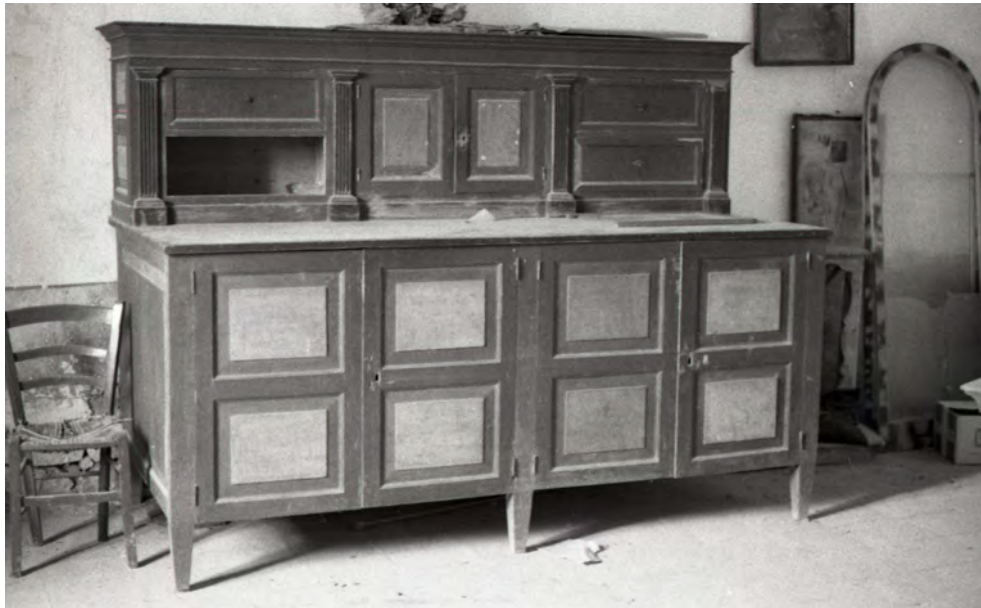
Sacrestia della chiesa conventuale. Foto in bianco e nero della prima metà degli anni '70 del XX secolo.