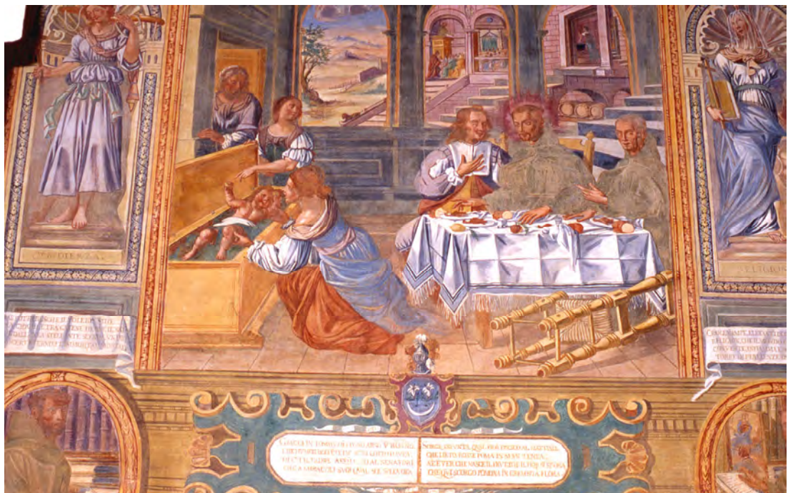
Convento di Galatina (prov. di Lecce). Miracolo del bambino caduto nell'acqua bollente. Foto del 2004.

Questa scena è raffigurata anche nel convento di Galatina, ed è stata dipinta nel 1696 da fra Giuseppe da Gravina.