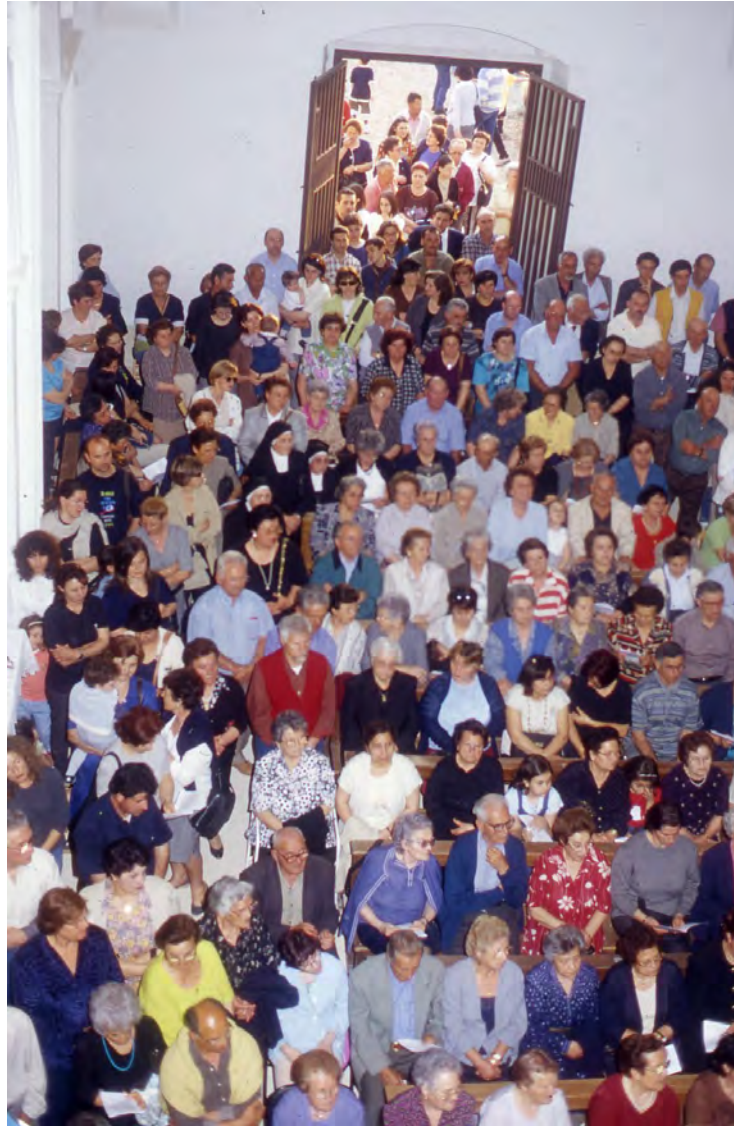
17 maggio 2000. Celebrazione eucaristica nella chiesa del convento di Santa Maria del Palazzo. Come si vede la chiesa è gremita di gente.