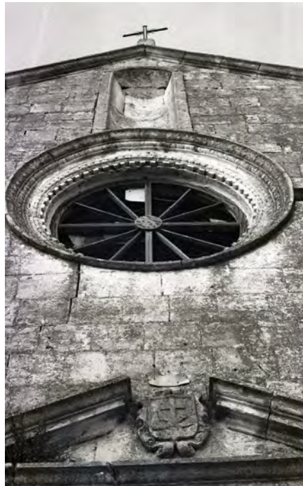
Facciata della chiesa con stemma (trafugato) dell'Ordine dei Frati Minori Osservanti. Sopra lo stemma il rosone, una nicchia e la croce. Foto in bianco e nero della prima metà degli anni '70 del XX secolo.

Attraverso la lettura di alcuni inventari custoditi presso l'Archivio di Stato di Bari è stato possibile conoscere quali erano gli arredi sacri, i quadri, le statue, i paramenti sacerdotali e i libri esistenti nella chiesa e nel convento di S. Maria del Palazzo nella prima metà dell'Ottocento.