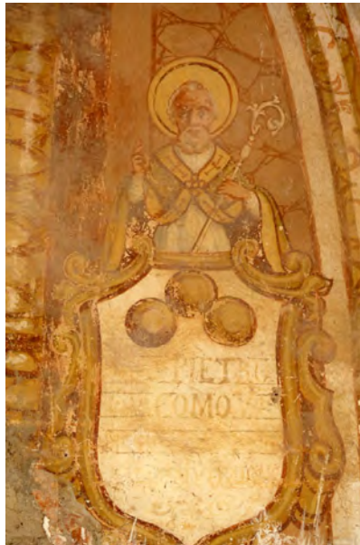
Chiostrò del convento di Santa Maria del Palazzo. Affresco raffigurante San Nicola di Myra. Foto della prima metà degli anni '70 del XX secolo.

frontale, regge con la mano sinistra il pastorale e con la destra benedice alla latina. Nell'altro affresco S. Nicola è raffigurato a figura intera, anch'esso in posizione frontale; sostiene con la mano sinistra il libro sul quale poggiano le tre sfere d'oro, e con la mano destra benedice alla latina. La presenza di queste immagini nicolaiane nel convento degli Osservanti rappresenta una testimonianza dell'accoglienza della figura di San Nicola da parte dell'Ordine francescano, accoglienza motivata dal fatto che come S. Francesco anche S. Nicola è protettore dei poveri e difensore degli oppressi. Infatti anche nella chiesa dei Cappuccini di Rutigliano, a destra della pala dell'altare maggiore, è raffigurato il santo vescovo Nicola con i soliti attributi.