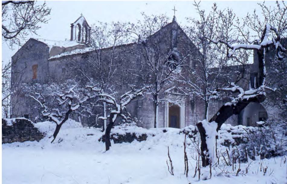
Chiesa, innevata, del convento di Santa Maria del Palazzo. Rutigliano (BA).