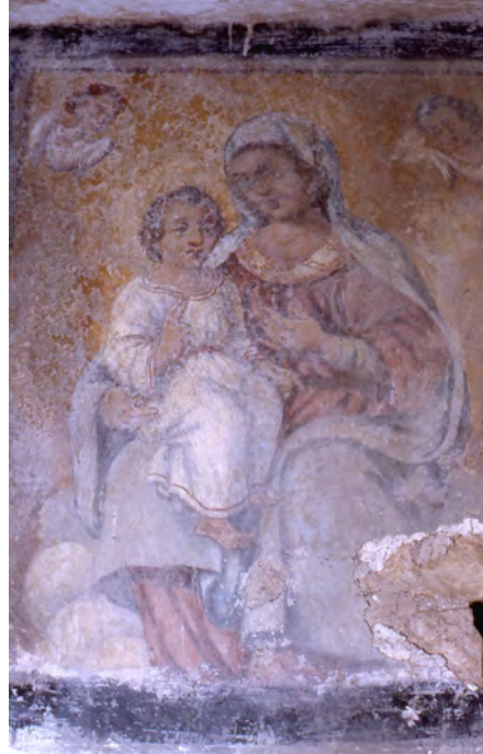
Scala di accesso al primo piano del convento con un affresco della Madre di Dio con Bambino. Foto della prima metà degli anni '70 del XX secolo.