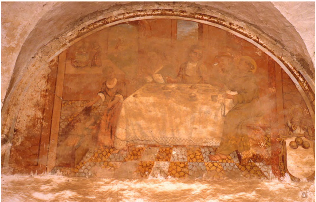
Chiostro del convento di Santa Maria del Palazzo. Miracolo del bambino caduto nell'acqua bollente. Foto della prima metà degli anni '70 del XX secolo

Lunetta n. 12: Miracolo del bambino caduto nell'acqua bollente ( Bac. pp.32. 197-199).