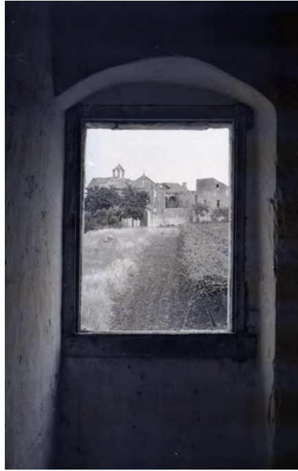
Convento di Santa Maria del Palazzo. Foto in bianco e nero della prima metà degli anni '70 del XX secolo.

Nella seconda metà del XVIII secolo S. Maria del Palazzo fu, tra i quattro conventi di Rutigliano, il più distante dal centro abitato. E' l'epoca in cui Rutigliano conta il maggior numero di preti, religiosi, frati laici e monache. Nel 1769, ad esempio, su una popolazione di 3878 abitanti, 82 erano preti e chierici, 49 religiosi e frati laici e 65 monache e converse. In questo stesso anno la comunità dei frati del convento degli Osservanti era composta dai religiosi sacerdoti: