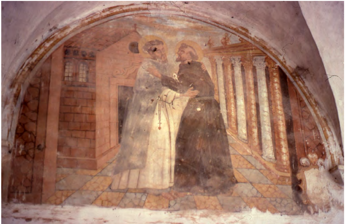
Chiostro del convento di Santa Maria del Palazzo. Abbraccio tra s. Francesco d'Assisi e s. Domenico di Guzman. Foto della prima metà degli anni '70 del XX secolo.

Lunetta n. 6: Abbraccio tra s. Francesco d'Assisi e s. Domenico di Guzman (2 Cel. CIX,148; 2 Cel. CX,150; Spec. 43; Cronache ed altre testimonianze francescane , Pietro Giovanni Olivi).