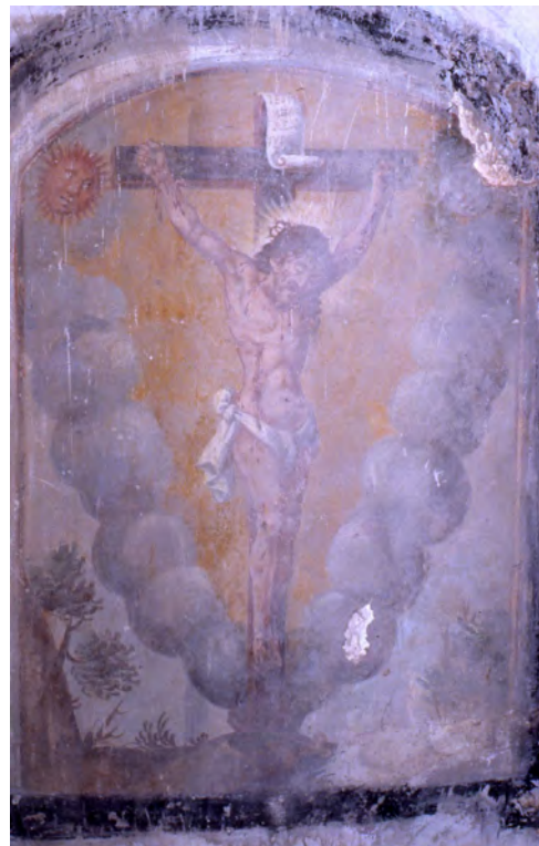
Affresco raffigurante Gesù crocifisso. Foto della prima metà degli anni '70 del XX secolo.