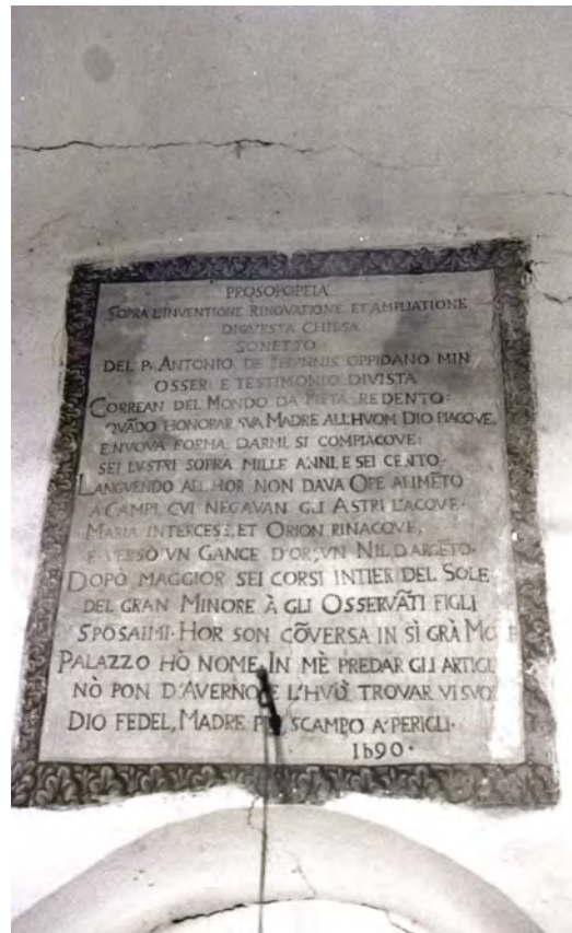
Foto in bianco e nero della prima metà degli anni '70 del XX secolo.