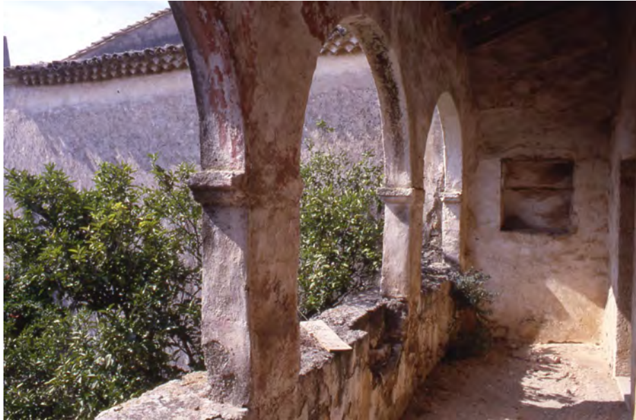
Loggiato, del primo piano, del convento di Santa Maria del Palazzo. Foto degli anni '80 del XX secolo.