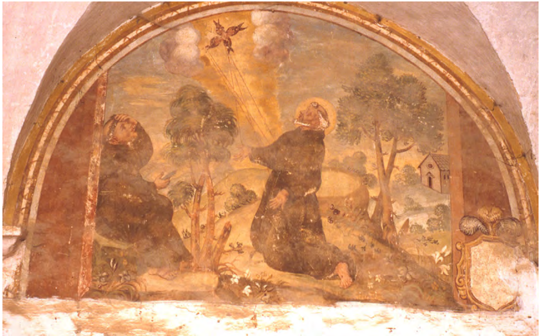
Chiostro del convento di Santa Maria del Palazzo. Francesco riceve le stimate. Foto della prima metà degli anni '70 del XX secolo.

Lunetta n. 19: Visione del serafino alato e stimate di Francesco ( I Cel. III,94-95; Leg. mag. XIII,3; Leg. min. VI,I-III; Tre Comp. XVII,69; Fior. , Delle Sacre Sante Istimate di Santo Francesco , terza considerazione; Cronache ed altre testimonianze non francescane , Episodi particolari , Luca di Tuy).