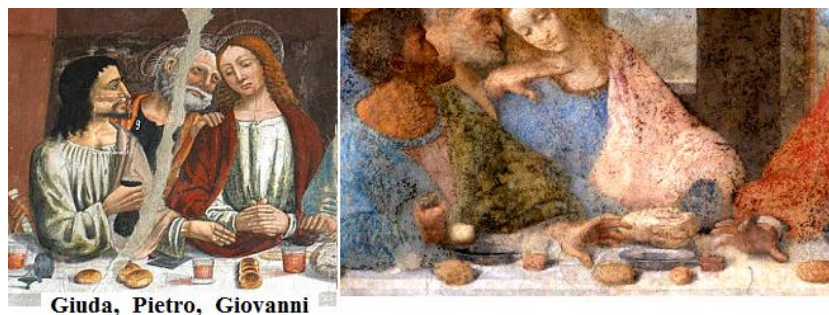
Figura 4: I gesti sono simili (dettaglio dell'affresco di Revello a sinistra, si veda la didascalia della Fig.1).

Torniamo ai personaggi. Dal confronto delle Figure 1 e 2 è evidente che i discepoli sono esattamente nelle stesse posizioni rispetto a Gesù. Giuda, come già detto senza aureola, ha il sacchetto dei denari in mano. Anche i gesti sono simili: un esempio è mostrato nella Figura 4. Ovviamente troviamo lo stesso dito puntato da Tommaso verso l'altro. Ma c'è una differenza notevole: Giacomo Maggiore non si frappone col suo braccio tra Tommaso e Gesù in modo così deciso come mostrato da Leonardo (Figura 5). In effetti, Leonardo ha mostrato nell'Ultima Cena di avere una profonda conoscenza del linguaggio non verbale del corpo e dei gesti, tanto che la sua opera è simile ad un "catalogo" di emozioni [7]. Può essere che l'autore dell'affresco di Revello considerasse il linguaggio del corpo usato da Leonardo troppo forte, specialmente in questo caso, dove Giacomo ferma Tommaso nel suo impeto verso Gesù. Era troppo forte per un ambiente cortese come quello che frequentava la Cappella Marchionale.