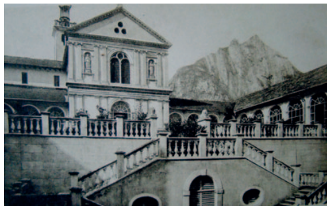
18) Scalinata a doppia rampa e chiesa di San Marco di Vedana. GDR