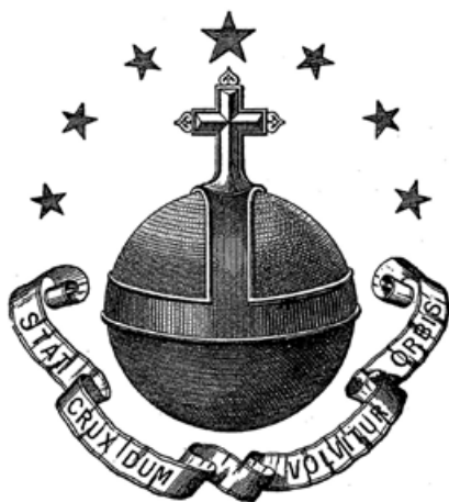
29) Rappresentazione del motto certosino.