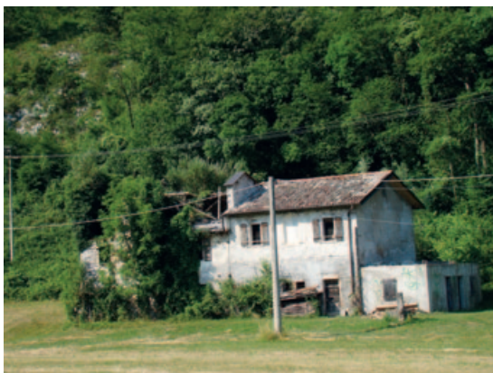
15) La costruzione abbandonata in località Case Molin, presso il Peron, che fungeva da mulino.