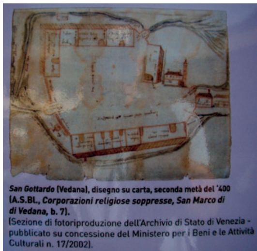
14) Disegno quattrocentesco del borgo di San Gottardo, con una roggia e una sega idraulica (in alto) - foto del pannello didascalico a S.Gottardo.