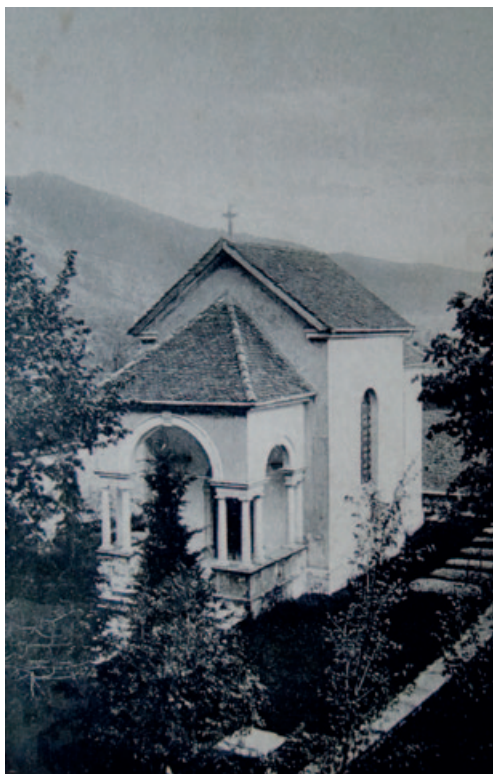
8) La cappella del cimitero.