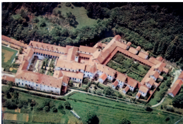
7) La certosa di Vedana vista dall'alto: al centro il chiostro piccolo e la chiesa, a destra il chiostro grande con le celle, a sinistra l'attuale "domus inferior". GDR

durante gli anni di costruzione della certosa e che oggi corrisponde al borgo di San Gottardo; attorno a questa "domus inferior" sorsero le prime attività agricole e artigianali promosse dai certosini.