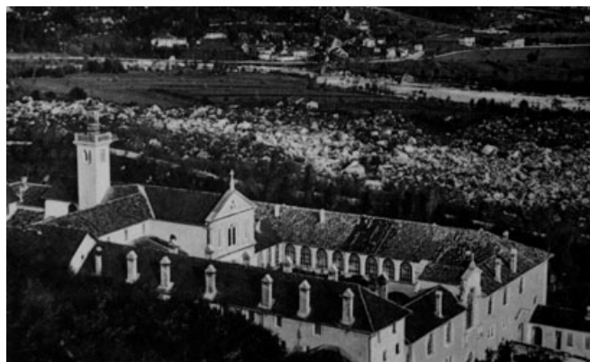
10) La "domus inferior" della certosa, con la chiesa di S.Marco, le Masiere, il Cordevole e Mas di Sedico - prima metà del Novecento. GDR

La comunità monastica certosina, inizialmente bipartita fra padri e conversi, risulta tuttavia più composita nei secoli successivi, per il calo delle vocazioni dei conversi; attorno a essa gravitavano anche i donati, i clerici