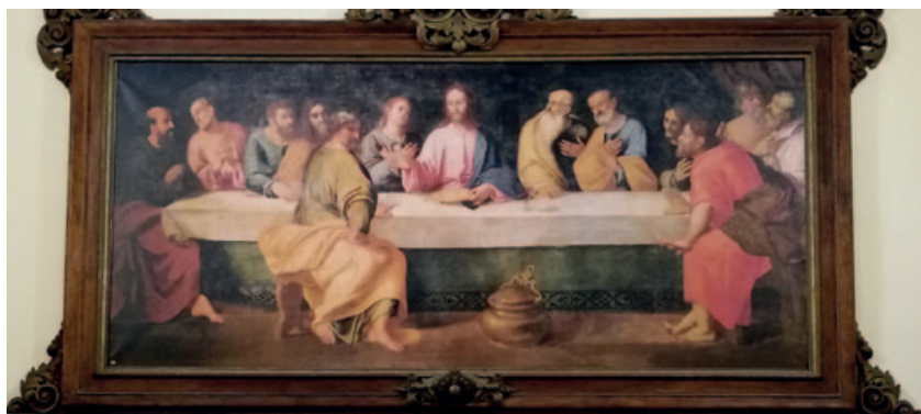
24) Refettorio, Ultima cena di Cesare da Conegliano