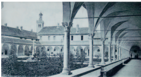
25-26) Il grande chiostro. GDR