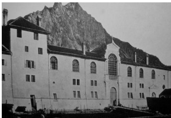
3) La facciata principale della certosa di Vedana - 1896. GDR