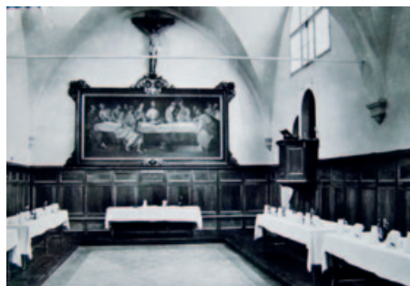
23) Il refettorio. GDR