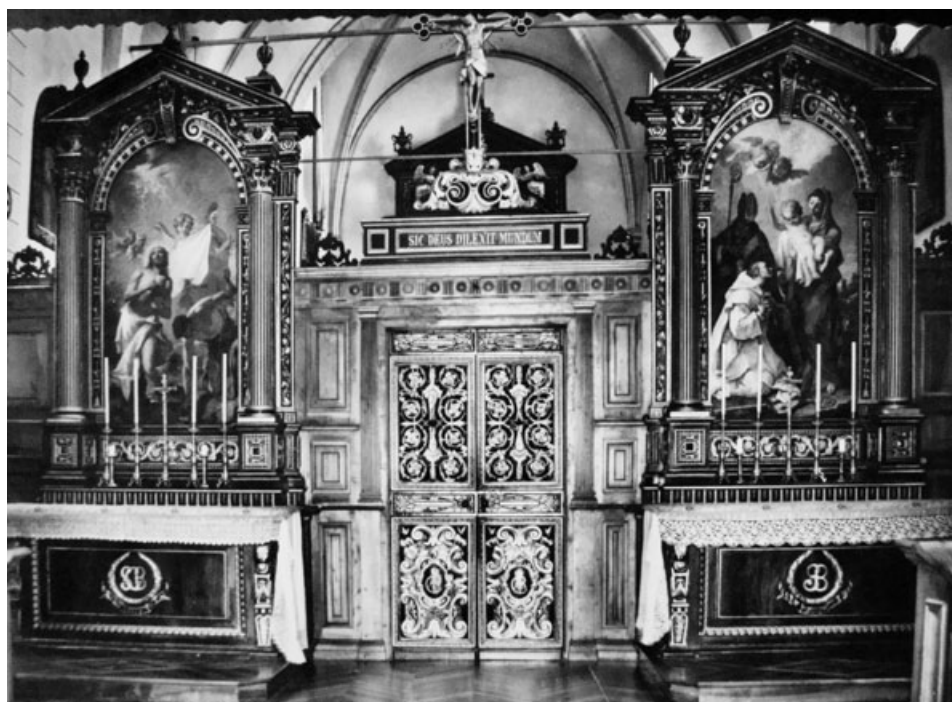
20) Tramezzo del coro con pale di Sebastiano Ricci. GDR