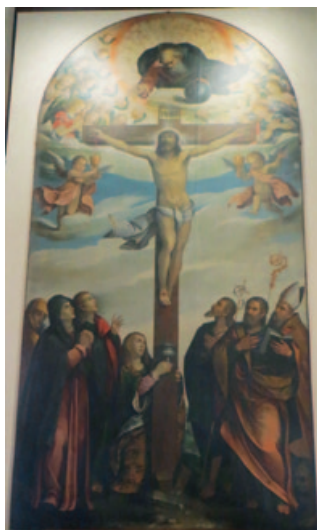
19A-B) Pala d'altare, di Francesco Frigimelica. GDR (in bianco e nero). A colori: Museo diocesano di Feltre