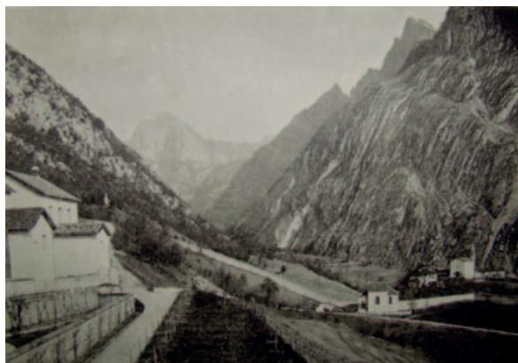
4) Il borgo e la chiesa di San Gottardo (a destra) e la certosa di Vedana con la cappella del cimitero - 1896. GDR

bardo ed è stato ipotizzato che i castelli di Misso e Costa potessero essere di origine longobarda, anche se sono documentati solo nel Basso Medioevo, come proprietà dei Caminesi. Longobardi e ostrogoti erano ariani: a Belluno, come in altre zone, imposero vescovi ariani, che si affiancarono e spesso sostituirono i vescovi cattolici, che vennero banditi dalle loro sedi e furono costretti a operare e a essere sepolti fuori dal perimetro cittadino, in un periodo