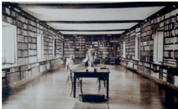
27) Biblioteca, situata sopra il refettorio. GDR

Il monogramma CAR (Cartusia) intrecciato con una croce latina è molto usato in Italia nei sigilli e negli stemmi delle singole Certose. È presente sopra il portone d'ingresso della certosa di Vedana (Fig. 28), ma anche su una chiave di volta di un antico magazzino (data 1605 o MDCV) e sull'arco della facciata sud dell'ospizio del Peron (data 1730) e in un timbro a secco della Certosa di Vedana (Le chiese nella parrocchia di S.Gottardo, p. 43).