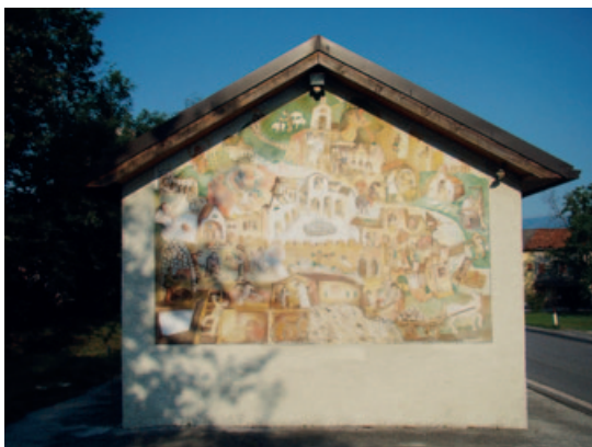
5A) Affresco dell'antica città di Cornia di Vico Calabrò, a Ponte Mas.

Nei tre secoli di vita dell'ospizio si ricorda un episodio particolare: sabato 10 giugno 1402 frate Frassenello da Bolago, priore di Vedana, annegò cadendo da cavallo nell'attraversare il Cordevole in piena,