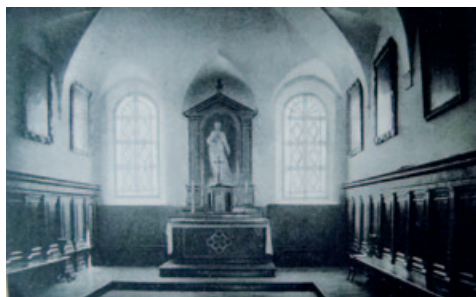
22) La sala del Capitolo. GDR