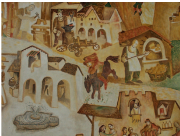
5B) Dettaglio dell'affresco dell'antica città di Cornia di Vico Calabrò, con attraversamento del Cordevole a cavallo.

per venire a Belluno; l'acqua spinte sulla riva del Peron il cadavere che, lo stesso giorno, fu trasportato nella chiesa del monastero, dove, domenica 11 giugno, venne esaminato dal canonico bellunese Clemente Miari, che ne trascrisse la notizia in una sua cronaca ( L'Oro di Cornia , p. 136). Nelle leggende locali si è tramandato il ricordo del rischio connesso a questo attraversamento del Cordevole (Fig. 5A-B). Sono solo parzialmente noti i motivi per cui, dopo circa 300 anni, il capitolo dei canonici di Belluno decise di cedere la proprietà dell'ospizio di Vedana all'ordine certosino; sappiamo che nel 1410 un "governatore" di Vedana, Bolzano da Bolzano, venne licenziato in tronco per una cattiva gestione dei conti ( L'Oro di Cornia , p. 137).