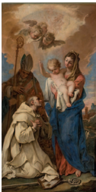
20A-B) Pale del tramezzo del coro, di Sebastiano Ricci.