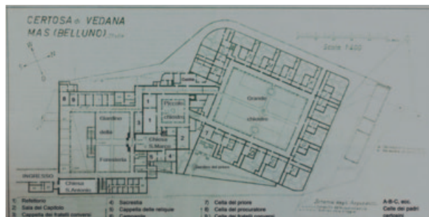
16) Pianta della certosa di Vedana.

Il francese Jean François Pichat, architetto dell'ordine certosino, ebbe l'incarico di ristrutturare e completare il complesso monastico della certosa di Vedana, con la chiesa di S. Marco a fine Ottocento, dopo il ritorno dei certosini del 1882; i lavori eseguiti portarono all'aspetto attuale (Fig. 16). Una salita rettilinea conduce dalla strada provinciale all'ingresso del monastero (Fig. 17); lungo questa stradina ci sono due cancelli, ai lati opposti, che danno accesso, rispettivamente, alla zona in cui si trovavano i pollai (sinistra) e al grande parco della certosa (destra), con la sua cinta in mura, le stalle, il cimitero con la vicina cappella. Al termine della salita, sulla destra, si trovano una piccola foresteria (rinnovata nel 2019) e una chiesa, dedicata a S. Antonio, aperta al pubblico e restaurata nel 2019; all'interno, sulla parete nord, opposta alle vetrate, ci sono 4 tele del pittore viterbese Domenico Corvi (1721- 1803), dipinte nel 1758 39 .