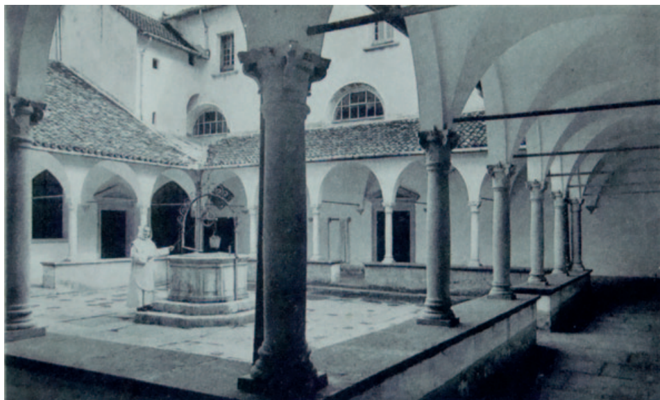
21) Il piccolo chiostro. GDR