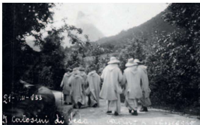
9) "Spatiamentum" dei certosini di Vedana, nel 1933. Dal blog cartusialover

in modo più rilevante di quello dei padri; possono lavorare anche all'esterno della certosa e, con il lavoro fuori della cella, assicurano i diversi servizi alla comunità (cucina, panetteria, falegnameria, sartoria, lavanderia, orto, frutteto, lavori nei boschi); anche i conversi hanno un percorso formativo di 7 anni, simile a quello dei padri, che termina con i voti solenni.