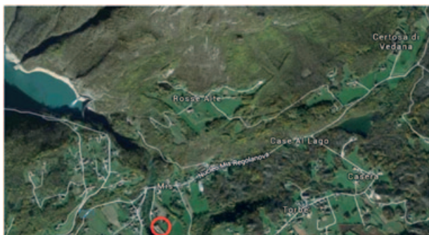
13) Localizzazione del luogo (cerchio rosso) presso Mis di Sospirolo, dove erano situati i vari opifici idraulici (fucina, follo, mulino e sega alla veneziana) - elaborazione da Google Map.

L'attività economica promossa dai certosini di Vedana comprese anche l'uso di diverse macchine idrauliche nel territorio contiguo alla Certosa, fra il XVI e XVIII secolo. Tra le «Possessioni di Vedana», cioè fra le proprietà della Certosa, un documento inedito non datato ricorda, infatti, fra l'altro: «Osteria e molin al Peron; Molin a Mis, Fornace a Piz, Fucina a Mis, Folo in Regola nova di Vedana, Sega al Mis» (ASBL, Fondo Vedana, Armaro Feltre , b. 19). Altri documenti confermano che i certosini di Vedana, oltre a un mulino e a una sega alla veneziana, avevano anche una propria fucina «per batter ferro» e una galchiera o follo per battere la lana e un pilaorzo presso Mis di Sospirolo, allo sbocco della Valle, non distante dalla chiesa di S.Giuliana e dai resti del castello di Mis, costruiti sul finire del Seicento (Fig. 13); la domanda per la costruzione della fucina e del follo fu presentata nel 1684 dal procuratore Fedele Ma-