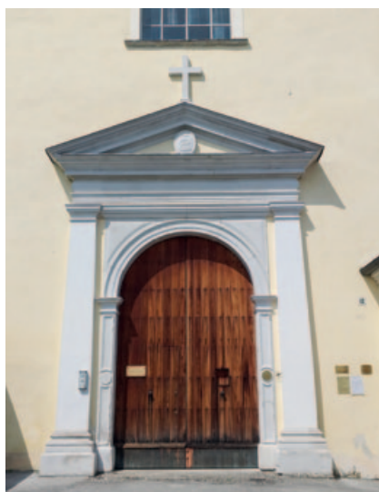
17) Portone d'ingresso della certosa di Vedana.

il refettorio (Fig. 23), la cui parete breve è adiacente al coro, e in cui si trova il grande quadro dell' Ultima Cena attribuito a Cesare da Conegliano (sec. XVI) (Fig. 24); dal refettorio si può accedere alla cappella dei fratelli conversi. Dal piccolo chiostro, con una scala, si può quindi accedere al grande chiostro, attorno a cui sono collocate le celle dei certosini (Fig. 25-26).