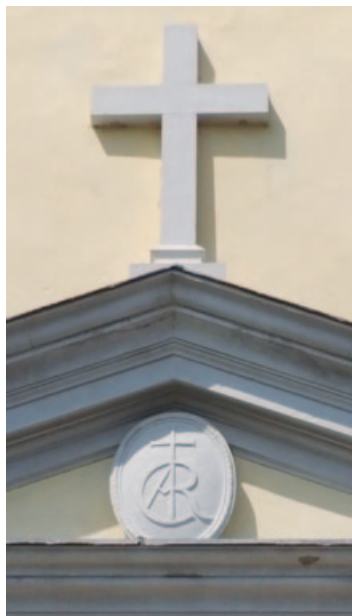
28) Il monogramma CAR sopra il portone d'ingresso della certosa.