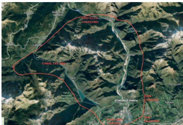
11) Ricostruzione del territorio compreso nella concessione mineraria del 1482 al priore di Vedana - elaborazione da Google Map.

in istis montibus apud monasterium nostrum aliquam evidentiam vene argenteae et plumbeae ) e che alcuni nobili veneti si sarebbero impegnati a finanziare gli scavi ( aliqui nobiles veneti vellent exponere aliquas pecunias ad fodendum in ipso monte ), ma chiedevano garanzie; il Capitolo rispose in modo positivo a questa richiesta. Sembrano quindi che la concessione del 1482 fu seguita da effettivi lavori di scavo, probabilmente nell'Alta Valle del Mis, che faceva allora parte del territorio feltrino, dove esistevano le miniere di Pian della Stua e di Le Loppe, sfruttate fin dal XV-XVI secolo, consentendo la produzione di rame, ferro e piccole quantità d'argento 31 . Le ricerche del Gruppo archeologico agordino ARCA hanno dimostrato che, nell'area di Le Loppe, si svolse un'attività di arrostitimento di minerale, principalmente fra XV e XVI secolo, ma anche, specificamente, negli anni relativi a questa concessione al priore di Vedana (Notiziario ARCA 2019, n. 41).