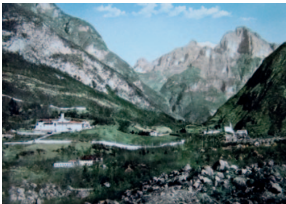
2) Certosa di Vedana, allo sbocco della valle del Cordevole, con la cappella del cimitero e il borgo di San Gottardo e le masiere - Prima metà del Novecento. GDR

La certosa di Vedana sorge su un declivio alla base meridionale dei Monti del Sole, in comune di Sospirolo, dove la valle del Cordevole, detta Canale d'Agordo, si apre nell'ampia valle del Piave, a circa 10 km a ovest di Belluno, inserita nel Parco Nazionale Dolomiti Bellunesi, nei pressi del lago e delle masiere 2 (Fig. 2). La storia della certosa inizia nel 1455, quando il capitolo dei canonici della cattedrale di Belluno offrì all'ordine certosino un antico ospizio di sua proprietà, sorto già nel XII secolo 3 . Una prima comunità certosina si insediò già nel 1456, ma la nuova certosa fu incorporata all'ordine solo circa 10 anni più tardi. Essa rimase sempre un piccolo monastero e al momento della soppressione da parte della Repubblica di Venezia, nel 1769, mancavano ancora due lati del chiostro grande con le relative celle. Passata in mano privata, fu poi riacquistata dall'ordine certosino nel 1882, quando vi fu accolta la comunità dei monaci espulsi dalla certosa di Pavia. Fu allora