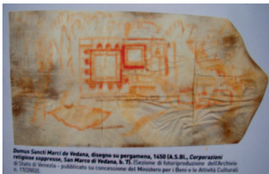
6) Progetto di costruzione della certosa di Vedana - 1450 circa - foto del pannello didascalico all'ingresso della certosa.

Esiste una pergamena sulla quale è disegnato il progetto della certosa ancora da costruire databile a circa il 1455 - 1456 17 (Fig. 6). Si tratta di un documento molto interessante che ha permesso di ipotizzare che l'antico ospizio fu trasformato in "domus inferior", che fu anche la sede provvisoria della prima piccola comunità di monaci,