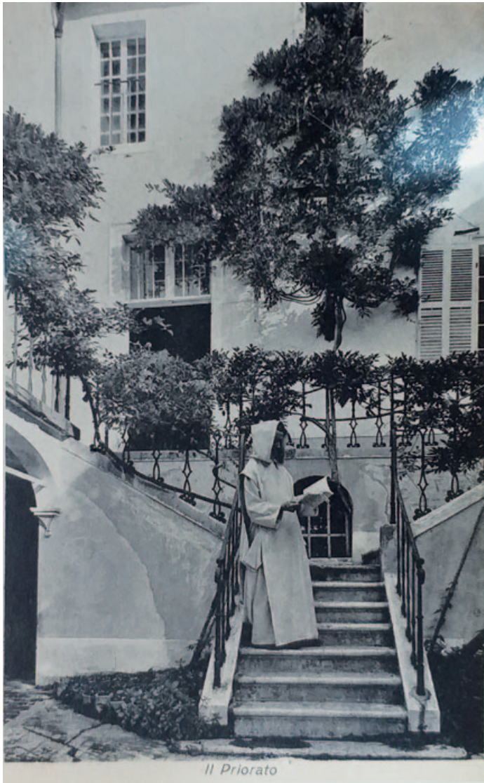
La cella del priore o il priorato