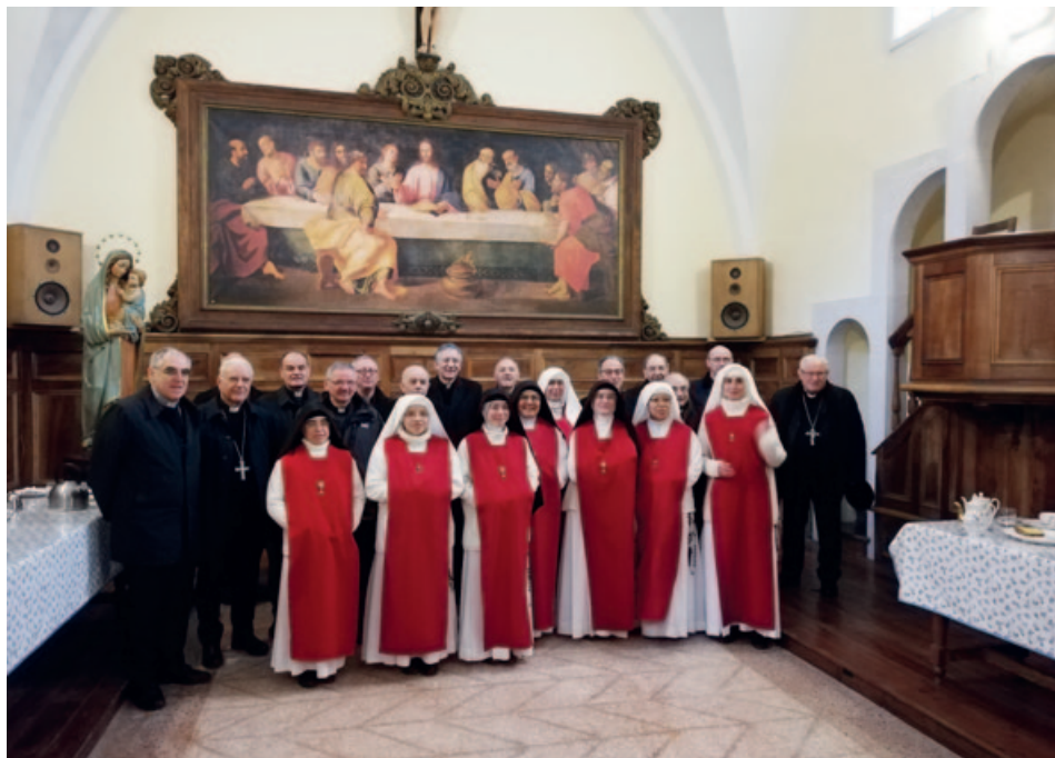
1) Le Suore Adoratrici del Santissimo Sacramento ricevono i vescovi del Triveneto nel refettorio della certosa - 6 aprile 2019.

Dall'estate del 2017 la certosa di Vedana rivive grazie a una comunità di suore Adoratrici perpetue del Santissimo Sacramento, per cui è stato eretto un nuovo ente religioso, civilmente riconosciuto, il Monastero di Nostra Signora del Santissimo Sacramento e dei santi Marco e Bruno; le 10 giovani monache di clausura provengono da Messico, Spagna, Italia, Croazia, Equador e Filippine; la loro presenza è preziosa. Si sono inserite in una realtà suggestiva e carica di storia, entrando in sintonia con il passato, dando vita al presente e speranza per il futuro (Fig. 1). L'atmosfera particolare che si percepisce immediatamente entrando nella certosa è uno stimolo a conoscere la storia di questo luogo, ricco di spiritualità.